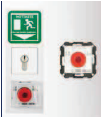
GEZE Türzentrale TZ 300 – Unterputzvariante

Türzentralen sind das „Gehirn“ eines leistungsfähigen Rettungswegsystems. Sie sichern und überwachen Öffnungs- und Schließvorgänge von Türen in Flucht- und Rettungswegen und sorgen dafür, dass Gebäude in Sekundenschnelle verlassen werden können. Die Single-Door-Türzentrale TZ 300 ist das Einstiegsmodell ohne Vernetzung für einfache Anwendungen oder kleinere Gebäude. Das filigrane und dennoch robuste Design, kleinste Baumaße und individuelle Farbgebung fügen sich harmonisch in jedes Gebäudedesign ein. Ein widerstandsfähiges im Schalterdesign integriertes Fluchtwegschild optimiert seine Wahrnehmung und dämmt die Gefahr von Zerstörung ein. Die flächig bedienbare Schlaghaube kann von jedermann auch in Paniksituationen schnell und sicher betätigt werden. Sie ermöglicht ein sicheres Auslösen der beleuchteten Nottaste.