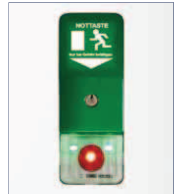
GEZE Türzentrale TZ 320 – Aufputzvariante