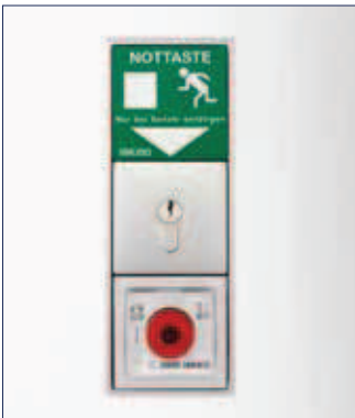
GEZE Türzentrale TZ 320 – Unterputzvariante

Die Türzentrale TZ 320 sichert und überwacht die Öffnungs- und Schließvorgänge von Fluchttüren in Rettungswegen. Die Fluchttür wird im Notfall direkt vor Ort (Nottaste) oder indirekt (Signal durch angeschlossene Sicherheitskomponenten wie Rauchmelder oder Gefahrenanlage) entriegelt. Die TZ 320 passt sich den unterschiedlichen Anforderungen jedes Wegekonzepts an. Dafür sorgen u.a. ihr individuell wählbarer Aufbau (1, 2 oder 3 Dosen) und ihre unkomplizierte Funktion als Schleusenanlage. Mit neuem Design, einfacher Installation und Bedienung und mit komfortablen Steuerungs-Funktionen ist sich nicht nur auf dem neusten Stand der Technik sondern erfüllt auch alle erforderlichen Sicherheitsvorschriften.