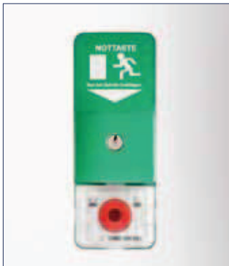
GEZE Türzentrale TZ 300 – Aufputzvariante

Dank der vorgefertigten Verbindung von der Steuerung zum Schlüsselschalter über Flachbandkabel und die bereits in die Steuerung integrierte Nottaste ist die TZ 300 einfach zu installieren. Anschlussfehler werden von vornherein so gut wie ausgeschaltet. Für die Minimierung von Fehlerquellen und Übersichtlichkeit sorgen auch die farbigen Installationsklemmen. Die Farbhilfe bedeutet zudem eine Zeitersparnis beim Anschluss der Systemkomponenten der Türzentrale. Bei veränderten Anforderungen oder Gebäudeerweiterungen, die zusätzliche Funktionalitäten und vernetzte Lösungen erfordern, kann die TZ 300 jederzeit durch die TZ 320 ausgetauscht werden. Dergleiche Aufbau der Klemmen beider Varianten hinsichtlich der Verdrahtung zum Verriegelungselement, wie z. B. zu einem Haltemagnet oder einem Fluchttüröffner, ermöglicht einen mühelosen Austausch der Steuerung. Das einfache Installationsschema ermöglicht Monteuren den sofortigen Anschluss der TZ 300 ohne vorherige Produkteinweisung. Auf die Türzentralen von GEZE kann sich im Notfall jeder verlassen. Sie sind geprüfte Sicherheit gemäß EltVTR.