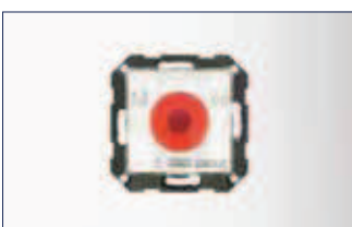
TZ 320 UP